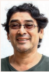
Assis SEC. DE ORGANIZAÇÃO E INFORMÁTICA Gama